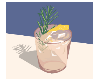
Rhabarber Fizz 7.9 Euro